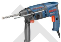
德國 Bosch 博世牌 GBH2-18 輕巧油壓電鑽