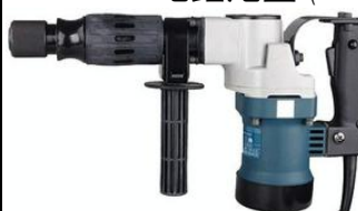
日本 Makita 牧田牌 HM0810 電錘炮鑿 (17mm)