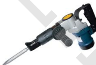
東成牌 Dongcheng ZIG-FF-6T 電錘炮鑿