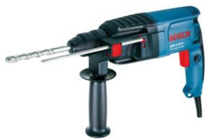
德國 Bosch 博世牌 GBH2-23S 油壓電鑽