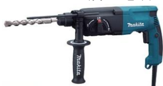
日本 Makita 牧田牌 HR 2460 油壓電鑽