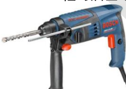
德國 Bosch 博世牌 GBH2-18RE 輕巧油壓電鑽