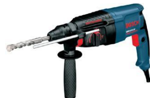
德國 Bosch 博世牌 GBH2-26DE 三用油壓鑽