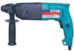
山崎牌 Asaki (特價套裝) AV224 三用油壓鑽