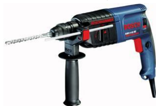
德國 Bosch 博世牌 GBH2-26E 大馬力油壓鑽