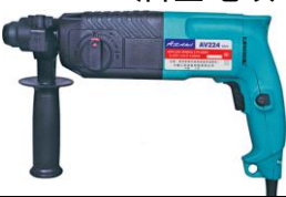
山崎牌 Asaki (特價套裝) AV220 油壓電鑽