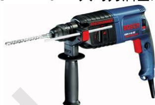
德國 Bosch 博世牌 GBH2-26RE 大馬力油壓鑽