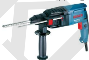
德國 Bosch 博世牌 GBH2-23RE 油壓電鑽