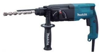
日本 Makita 牧田牌 HR 2470 三用油壓鑽鑽