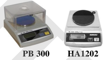
PB 300 HA1202