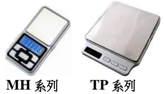
MH 系列 TP 系列