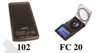
102 FC 20