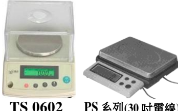
TS 0602 PS 系列(30 吋電線)