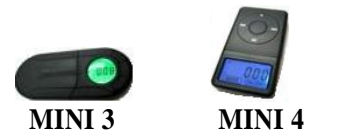
MINI 3 MINI 4